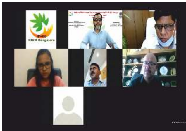
Secretary AYUSH addressing the participants of webinar on Pharmacovigilance