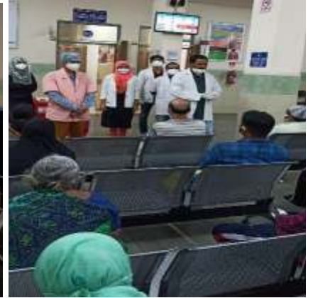
जनता के बीच पोषण जागरूकता का प्रसार करने में व्यस्त कर्मचारी और छात्र