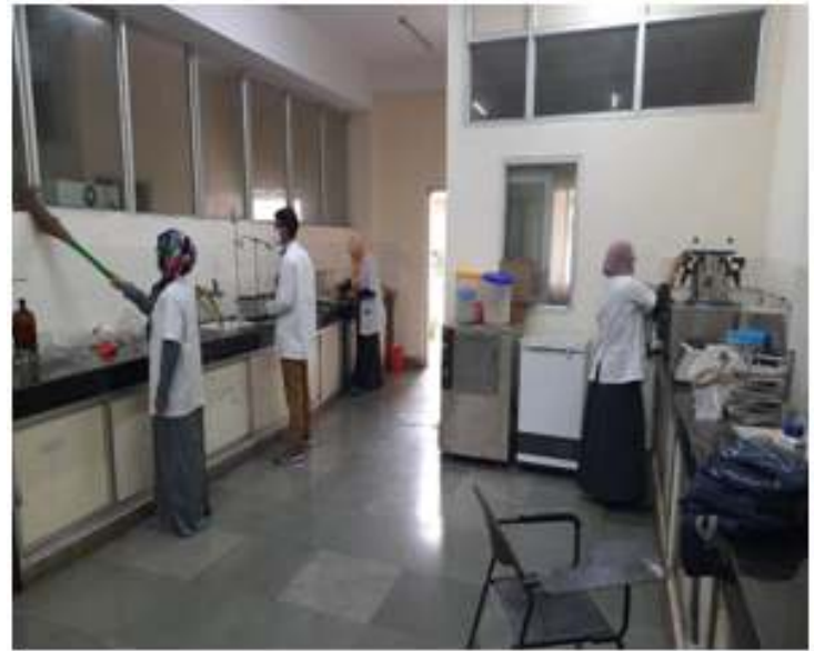
Administration of oath for swachhata followed by a cleaning drive at workstations