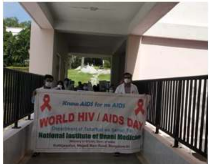
Public Health Awareness rally conducted by Department of TahaffuziwaSamaji Tib on world AIDS Day