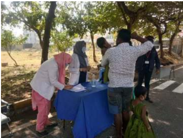
पल्स पोलियो टीकाकरण में जुटी एक समर्पित टीम