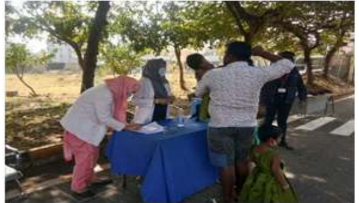
A dedicated team engrossed in Pulse Polio immunization drive