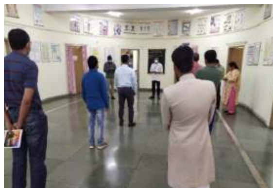
Staff and students taking Jan Andolan Pledge in Department of Tahaffuziwa Samaji Tib Observance of PoshanMaah

As part of the Poshan Abhiyan, Dept. of Tahaffuziwa Samaji Tib observed the month of September 2020 as PoshanMaah. Activities related to nutrition awareness were carried out During the PoshanMaah. The main emphasis of the activities was to highlight the importance and role of the balanced nutrition for the human body. The faculty members and PG scholars of the department spread the message of holistic nutrition throughout the month to ensure a healthier future for women and children.