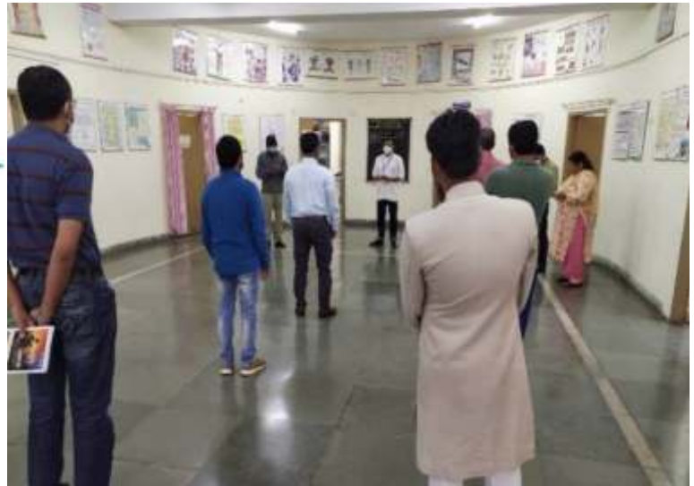
तहफुजी व समाजी तिब विभाग में जन आंदोलन शपथ लेते कर्मचारी और छात्र